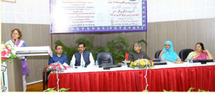
19 اگست 2019: مرکز برائے مطالعات ایرانیان یونیورسٹی آف گونگن جرجنی کے اشتراک سے شعبہ فارسی کے زیر اہتمام منعقدہ "انٹرنیشنل پرشین سمراسکول" کے افتتاحی اجلاس سے مخاطب پروفیسر ایوا آرتھمن۔