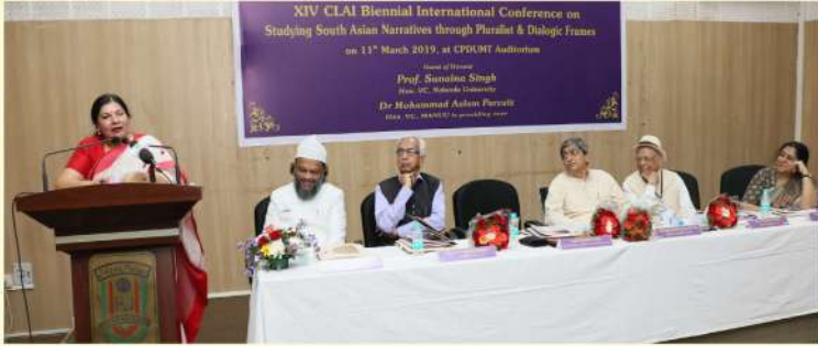
11 مارچ 2019: شعبہ انگریزی اور تقابلی ادب کی عالمی تنظیم کے زیر اہتمام ایک قومی کانفرنس سے مخاطب انگلش اینڈ فارن لینگویجس یونیورسٹی حیدرآباد کی وائس چانسلر پروفیسر سنینا سنگھ۔