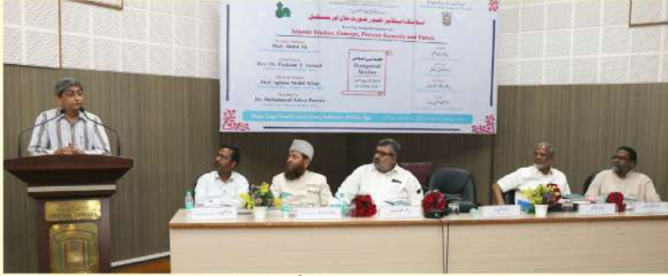
24 اپریل 2019: شعبہ اسلامک اسٹڈیز اور ہنری مارٹن انسٹی ٹیوٹ کے زیر اہتمام ”اسلامک اسٹڈیز: تصور صورت حال اور مستقبل“ کے موضوع پر منعقدہ قومی سیمینار سے وائس چانسلر ڈاکٹر محمد اسلم پرویز کا خطاب۔