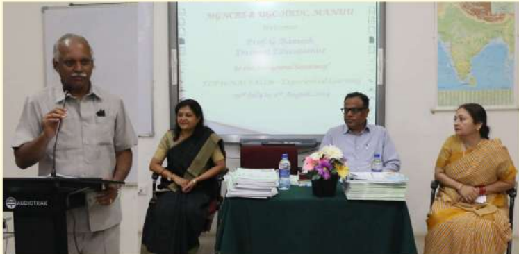
29 جولائی 2019: یونیورسٹی میں HRDC کے زیر اہتمام "نئی تعلیم" پر چھ روزہ ورک شاپ کے افتتاح کا منظر۔