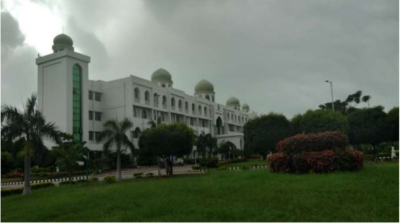
عمارتِ انتظامی، مولانا آزاد نیشنل اردو یونیورسٹی