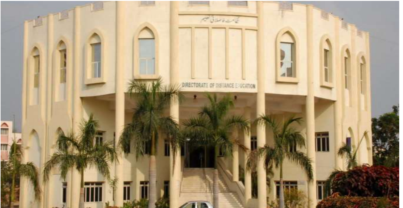
عمارتِ نظامتِ فاصلاتی تعلیم، مولانا آزاد نیشنل اردو یونیورسٹی

کمپوزنگ اور تزئین: ڈاکٹر محمد نہال افروز