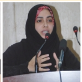
Girl students presenting papers in Seminar