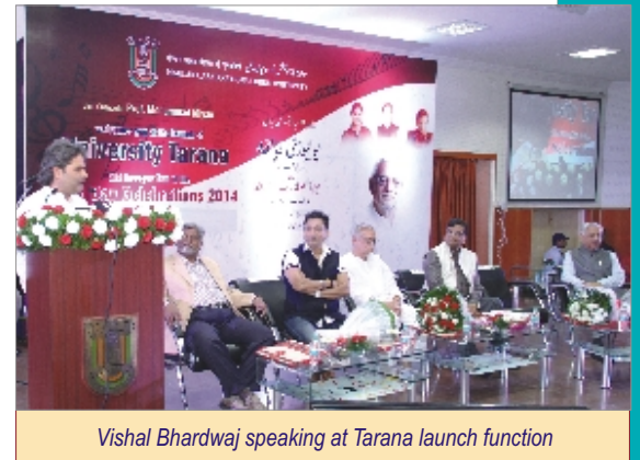
Vishal Bhardwaj speaking at Tarana launch function