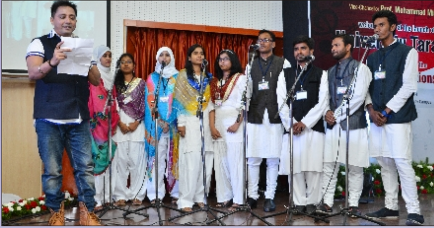
سکھویندر سنگھ مانو کے طلبہ کی ٹیم کے ساتھ ترانہ گاتے ہوئے۔