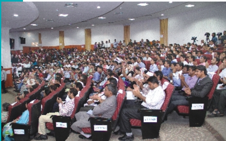
A section of audience at the Tarana launch