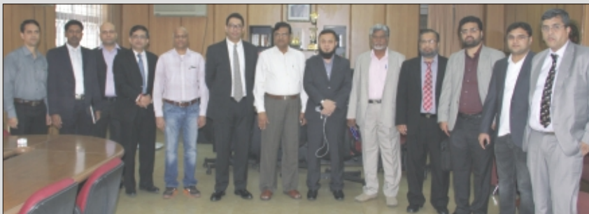
Industry delegates along with Chancellor, Vice-Chancellor and Registrar