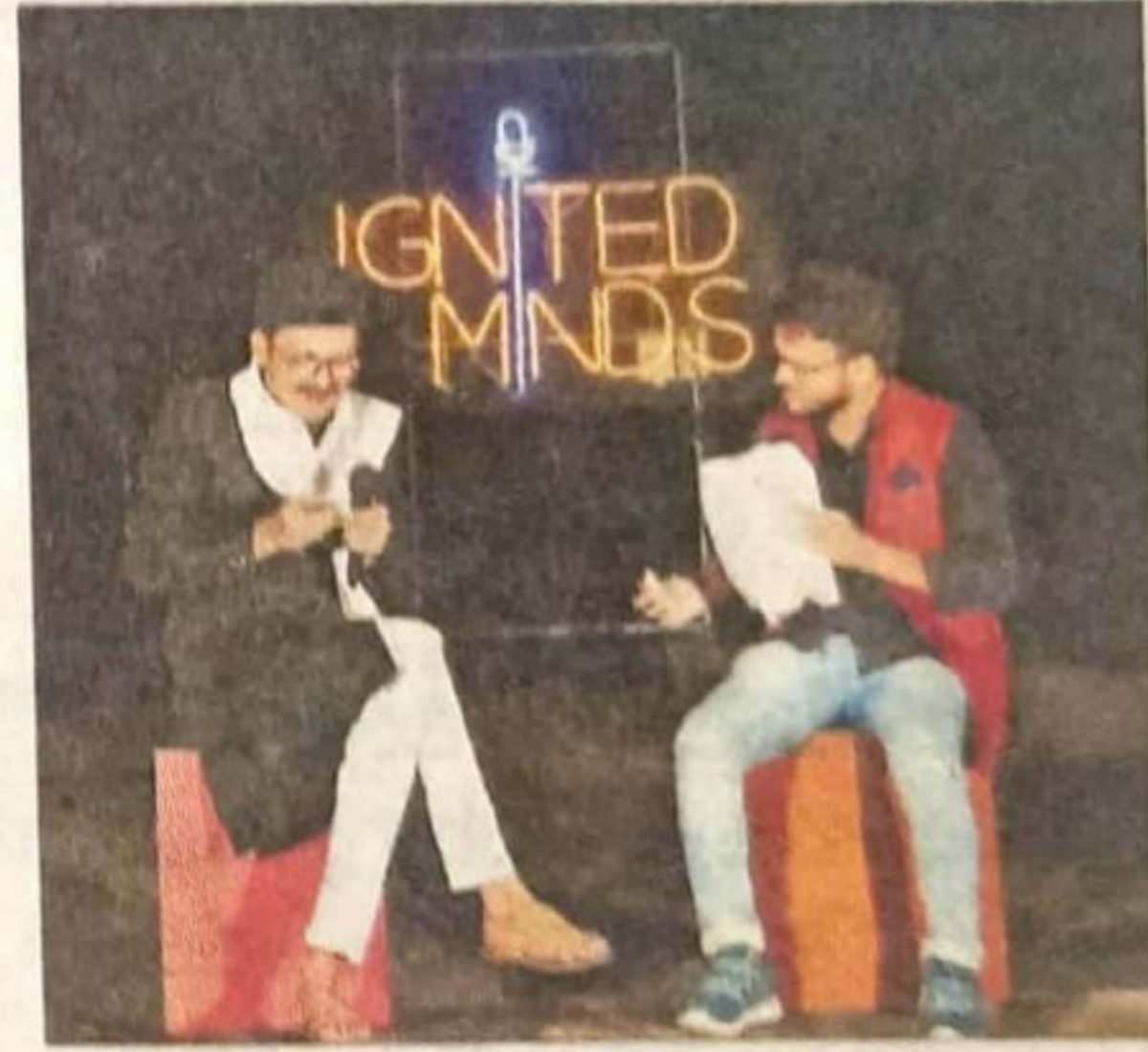
ఉర్దూ విశ్వవిద్యాలయంలో విద్యార్థుల ప్రదర్శన