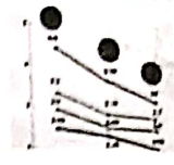
MUSLIM POPULATION GROWTH RATE: THE GAP NARROWS

The 2011 census data on population growth in Bihar shows a decline in the growth rate of the state's population. The growth rate in Bihar was 11.53% in 2011, down from 12.75% in 2001. This is the lowest growth rate among all states in India. The decline in growth rate is attributed to a number of factors, including a decline in fertility rates and an increase in mortality rates.