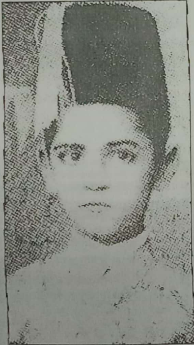
ذاکر حسین سات سال کی عمر میں